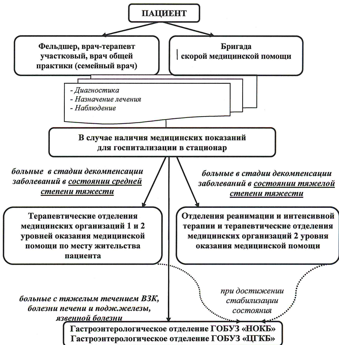
СХЕМА маршрутизации при оказании медицинской помощи пациентам с гастроэнтерологическими заболеваниями в неотложной и экстренной ситуации

При достижении стабилизации состояния пациенты, находившиеся на лечении в медицинских организациях 1 и 2 уровней оказания медицинской помощи, переводятся при необходимости в гастроэнтерологическое отделение или консультируются с врачом-анестезиологом-реаниматологом областного реанимационно-консультативного центра ГОБУЗ «Новгородская областная клиническая больница», ГОБУЗ «Центральная городская клиническая больница», оказывающие круглосуточную медицинскую помощь по профилю анестезиология и реанимация или гастроэнтерология, хирургия, терапия.